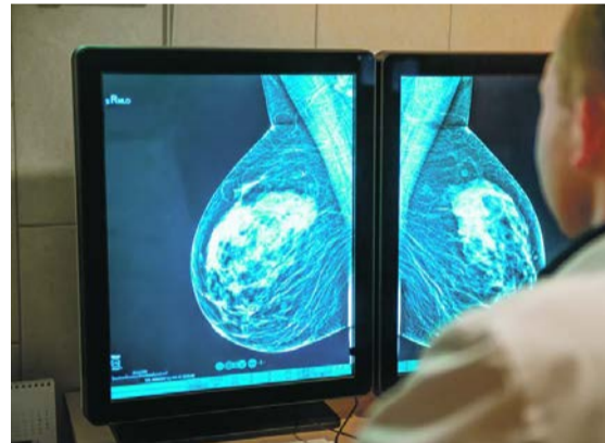
Les clichés sont analysés par deux radiologues indépendants l'un de l'autre.

A l'occasion de la Campagne annuelle Octobre Rose, les cliniques de Genolier, Montchoisi et Valmont organisent un dîner caritatif le jeudi 31 octobre à 19 heures, au Restaurant l'Escapade à Nescens - Clinique de Genolier. Offertes par des artistes régionaux et internationaux, des œuvres seront mises aux enchères au cours de la soirée. Tous les bénéfices seront reversés à la Ligue vaudoise contre le cancer. Inscription par email à evenement@genolier.net ou par téléphone au 079 694 15 13.