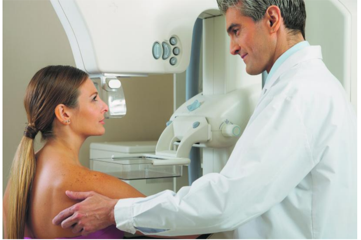
Tous les 2 ans, entre 50 et 75 ans, les femmes vaudoises se voient proposer une mammographie systématique.

Et chez nous? Depuis 1999, la Fondation vaudoise pour le dépistage du cancer du sein est mandatée par l'Etat pour organiser et gérer un programme de dépistage à l'échelle de tout le