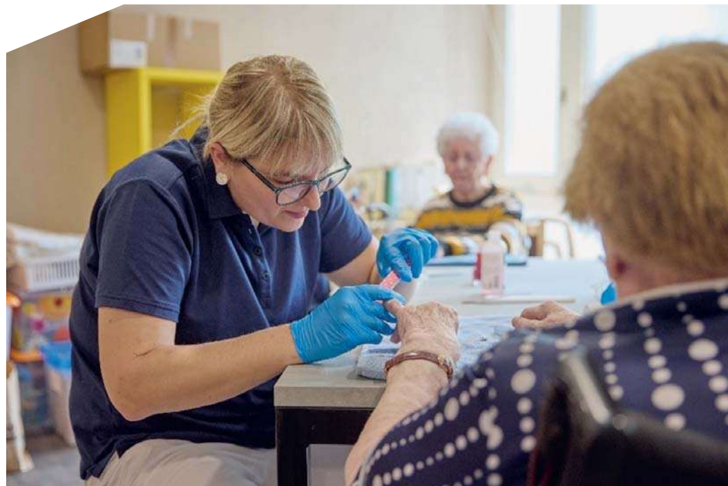
La vie dans l'EMS est rythmée par des activités quotidiennes.